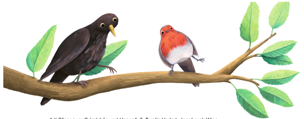
Agí Ofner aus: Grizzlybär und Hasenfuß, Tyrolia-Verlag • Innsbruck-Wien

Es flatterte zwar kurz auf, aber landete gleich wieder auf dem Ast und bewegte sich nicht mehr. „Vielleicht traue ich mich doch nicht“, murmelte es verlegen. „Sollen wir gemeinsam?“, fragte die Amsel. „Okay!“ „Die dahinten?“ „Ja. Du auf dem blauen und ich auf dem roten.“ „Auf die Plätze!“ – „Fertig!“ – „Los!“ Sie starteten gemeinsam. Ihre Herzen klopfen wie wild. Sie landeten gleichzeitig auf den zwei Sonnenhüten unter ihnen. Mit beiden Füßen und drei Sekunden lang. Mutprobe bestanden!