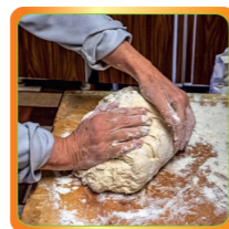
Gutes Leben – Brot backen, Brot teilen 22. bis 29. Sept.