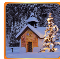
Gutes Leben – ankommen 30. Nov. bis 24. Dez.