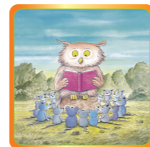
Gutes Leben – gute Geschichten 17. bis 24. Nov.