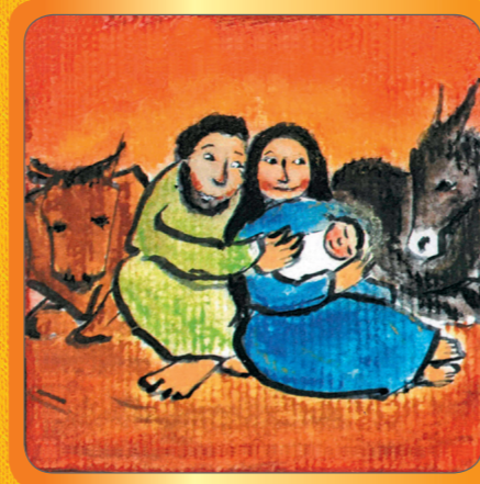
Advent – Mensch werden