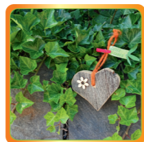
Gutes Leben – Herzlichkeit schenken 02. bis 09. Juni