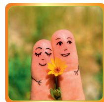
Gutes Leben – lebendige Partnerschaft 05. bis 12. Mai