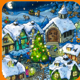
Türchen auf, Freude rein!