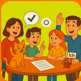
kleine Stimmen – große Wirkung